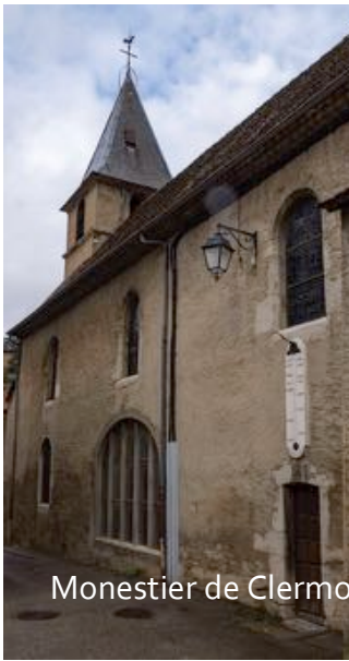
Monestier de Clermont

Pour une vue détaillée des cadrans de l'Isère et du Trièves on consultera avec profit le site : http://michel.lalos.free.fr/cadrans_solaires/