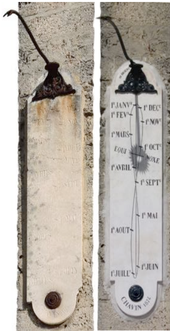
Montferrat : Avant et après restauration

Dans tous les exemples que nous avons trouvés, les méridiennes de Chavin sont réalisées en marbre blanc. Celle de Saint Jean d'Hérans avec sa pierre noire semble unique dans la production de Joseph Chavin.