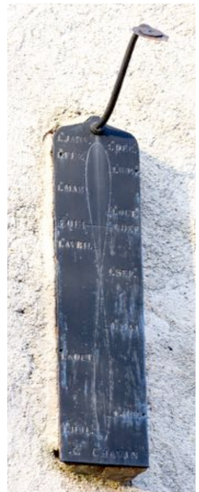
Eglise de Saint Jean d'Hérans Janvier 2020

Le soleil à midi solaire est bien toujours exactement au Sud, au plus haut en juin, au plus bas en décembre, matérialisant ainsi le méridien céleste. Mais vous ne trouverez pas midi (solaire) à 12 h et jamais non plus midi à 14 h !!!