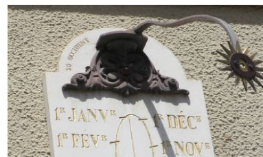
Méridiennes de St Egrève et Vizille.