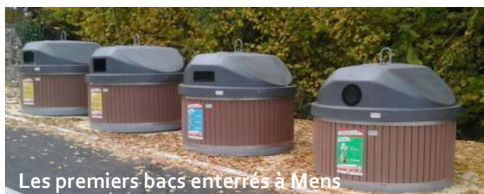
Les premiers bacs enterrés à Mens

Le projet de la communauté de commune (ayant la compétence de la gestion et du ramassage des déchets) concernant la mise en place de bacs semi enterrés, (voir le journal du Trièves n°9 et 10) se poursuit. Les premiers bacs devraient voir le jour, sur la commune en 2016. Dans un premier temps, seules les ordures ménagères devront bénéficier de cet aménagement, suivis à plus ou moins longue échéance, des bacs de tri sélectif: papiers,