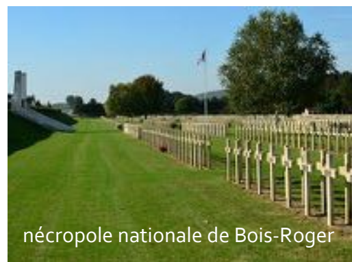
nécropole nationale de Bois-Roger

Le 12 Mars il relève le 221 ème RI qui a attaqué et repris une partie du terrain. Du 13 au 17 mars, son régiment continue l'effort commencé par une série d'attaques et de contre-attaques et atteint les objectifs qui lui étaient assignés. Dans la nuit du 19 au 20 Mars, la possession de la cote 185 est assurée. Les pertes pendant cette courte période sont de 12 officiers et 485 hommes.